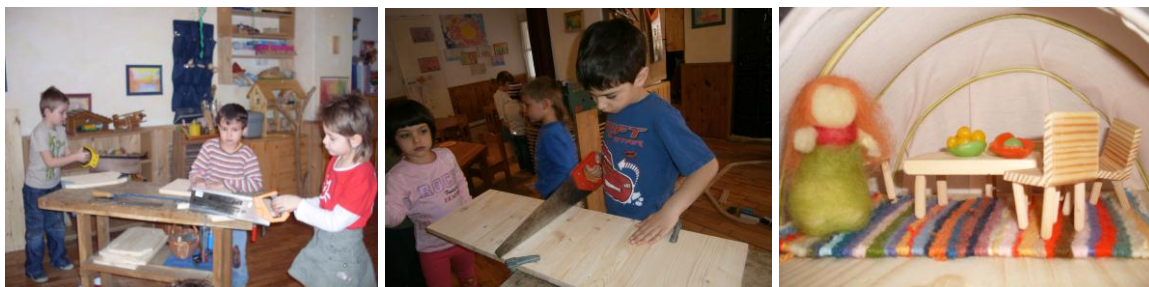
„Iskola munka” – babház készítése szőnyeg, bútor és baba

Ez a már említett szőnyeg szövéséből, babaház elkészítéséből, bútorok barkácsolásából és gyapjú babák készítéséből áll.